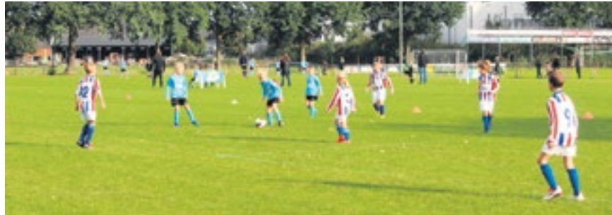
Voetbalplezier bij HMC'17.

Harreveld-Mariënveld - In navolging van de jeugd, die al sinds 2017 samen voetballen, zijn ook de senioren van VVM en KSH sinds afgelopen seizoen samen gestart onder de naam SSA HMC'17. Er is ontzettend veel werk verzet, zodat ook de senioren afgelopen seizoen in een prachtig nieuw HMC'17 tenue aan de competitie konden beginnen. Hier willen we onze sponsors nogmaals ontzettend voor bedanken, want zonder hun bijdrage was dit absoluut niet mogelijk geweest!