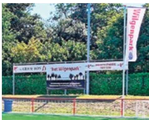
Door: Theo Huijskes

Groenlo - Een samenwerkingsproces, in dit geval een bewerkstelligde fusie tussen twee plaatselijke voetbalclubs, reeds begonnen in de vorige eeuw en na enkele mislukte pogingen in het tweede decennium van deze eeuw opnieuw opgepakt, mag inmiddels worden aangemerkt als een voor iedereen -jong en oud- doorslaggevend succes. S.V. Grol en S.V. Grolse Boys zijn sedert de inmiddels historische avond van maandag 7 oktober 2019, toen afzonderlijk in beide voetbalkampen tegelijkertijd het finale fusiebesluit werd genomen, één vereniging, één voetbalclub. Zoals ik het destijds zelf, in onze in het vestingstadje omarmde Groenlose Gids heb omschreven als een succesvol voetbalhuwelijk met een beloftevolle toekomst tussen de op dat moment 101-jarige sportvereniging Grol en de 71-jarige sportvereniging Grolse Boys.