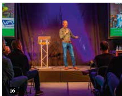
7. 8. 9. 15. Longa'30 – t Zwaantje Lichtenvoorde 10. 11. 12. Wedstrijd Longa'30 - RKZVC 13. 14. 16. BC Longa'30 - bij Wessels Bouwgroep