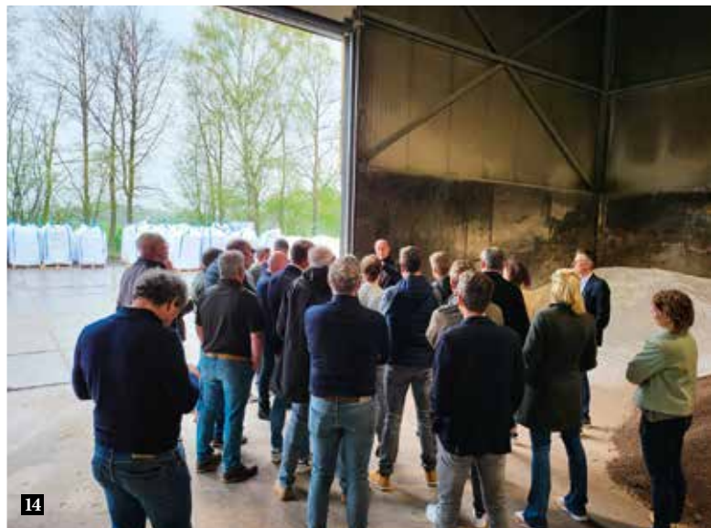
9. 10. 11. Seesing Tournament 12. 13. 14. BC RKZVC bij Groot Zevert Beltrum