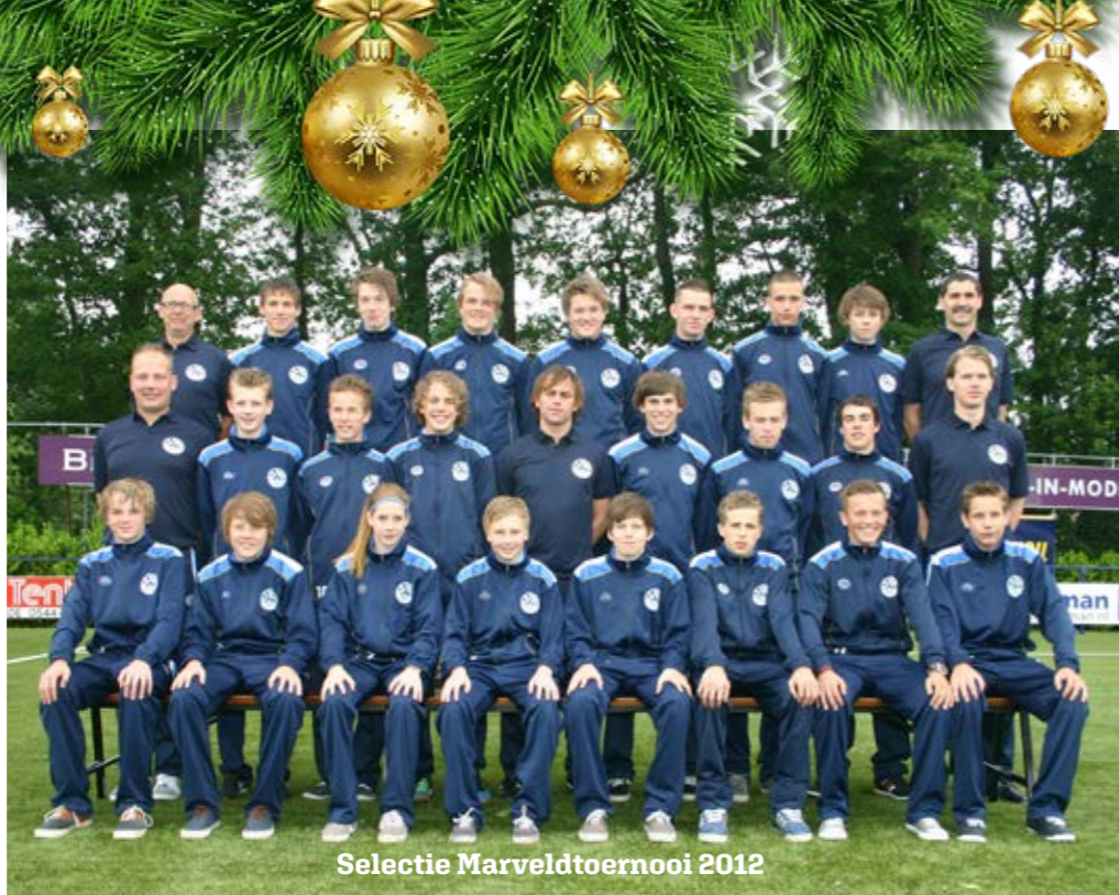
Selectie Marveldtoernooi 2012